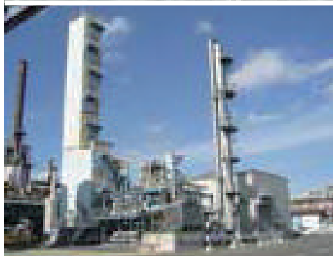
工業ガス製造設備