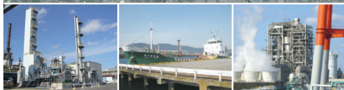
工業ガス製造設備